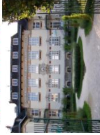
Accès par la Nationale 19