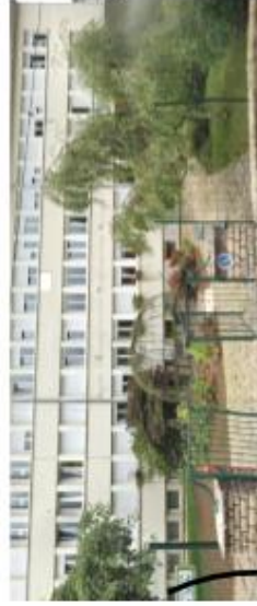
Accès par la Nationale 19